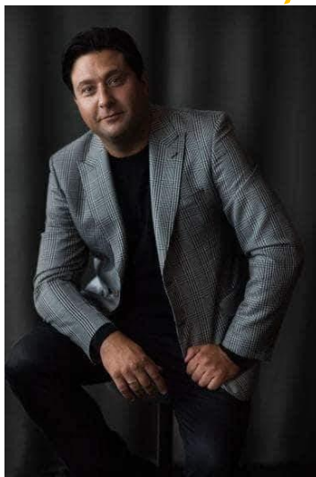
MINDAUGAS ROJUS (baritonas)