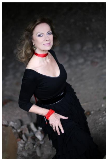
VIRGINIJA KOCHANSKYTĖ (aktorė)